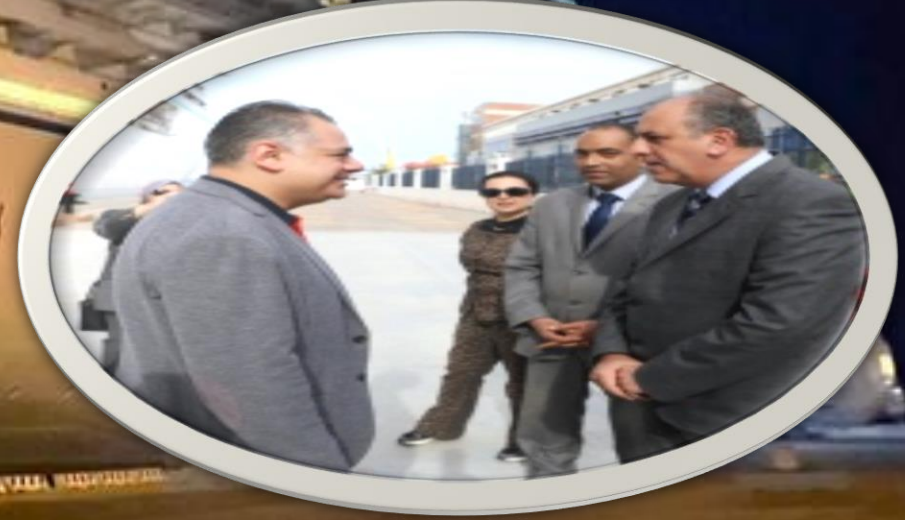
السفينة CRYSTAL SERENITY : على متنها 260 سائحا قادمة من ميناء Port Said وغادرت الميناء متجهه إلى ميناء Piraeus اليوناني