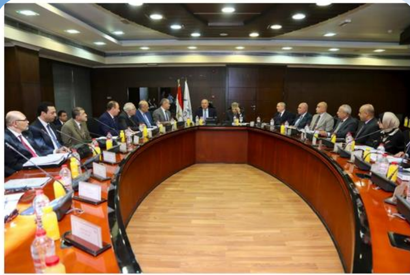
اجتماع الجمعية العامة العادية وغير العادية لشركة موانئ مصر البحرية

الجمعية العامة العادية وغير العادية لشركة موانئ مصر البحرية