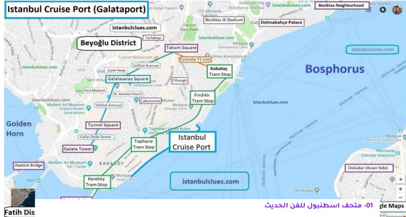
01- متحف اسطنبول للفن الحديث